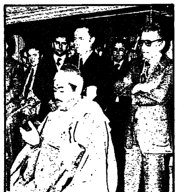
الاتحاد باي الفكر الحكيم من الشيخ محمد الطيلوي جون لتأسيس وشيوخه يتفقدون في خضوع على ظهر الباخرة مارينا بمدينة التسينا باليونان